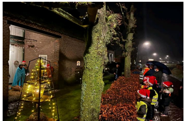
Team St. Jan