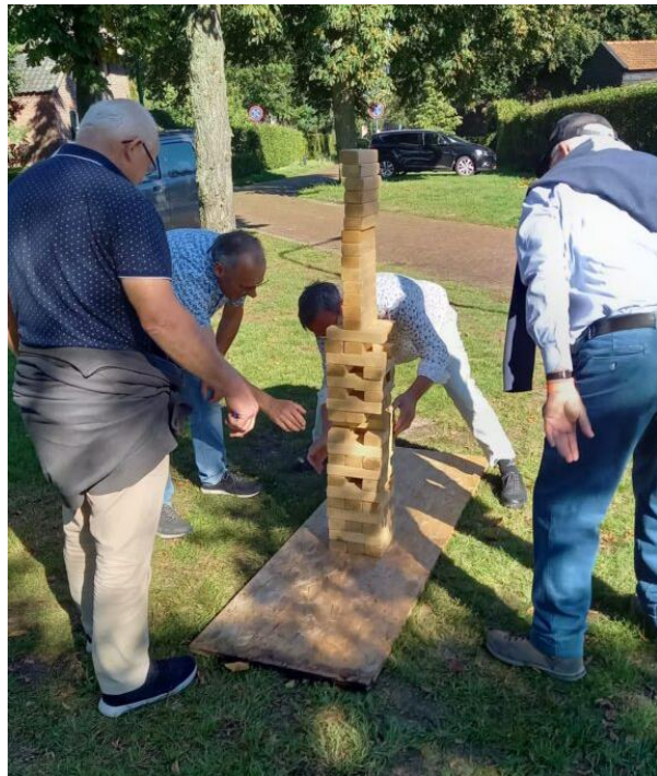
Team: "Bij de tijd"

Voor meer foto's zie www.leenderstrijp.com